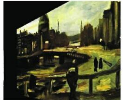
Yıldızlı Gece, Ters Cafe, Aries Köprüsü sergide yer alan tablolardan birkaçı