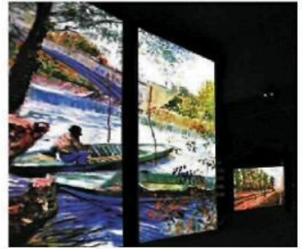
Sergide Van gogh'un eserlerinin yanı sıra not defterlerine ve sözlerine yer veriliyor