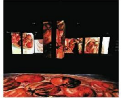
Dijital sergide dünyanın tek multi-projeksiyon sistemi kullanıldı