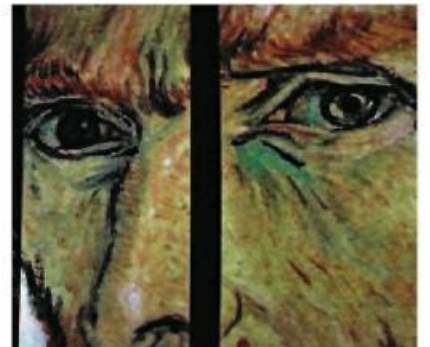
Eskiden otoportresi olduğu düşünülen bu tablonun (sağ) artık kardeşi Theo Van Gogh'a ait olduğu düşünülüyor