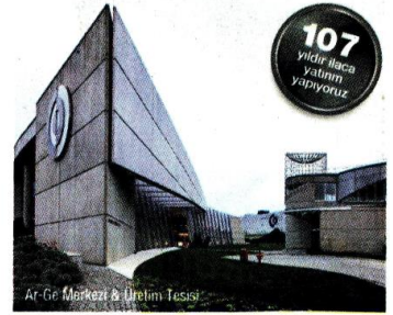
R&D Merkez & Üretim Tesisi

Yeni tesisler kurmanın yanında, mevcut konvansiyonel ilaç üretim tesisimizde de yatırım yapmayı sürdürüyoruz. Yüksek teknolojiye sahip tesislerimizde ulusal ve uluslararası 20 firmaya üretim hizmeti veriyoruz. Hedefimiz mevcut işbirliklerimizle 2019 yılında yenilerini katarak üretim hizmeti alanında daha da büyümek ve uluslararası firmaların Türkiye’deki üretim üssü olmak.